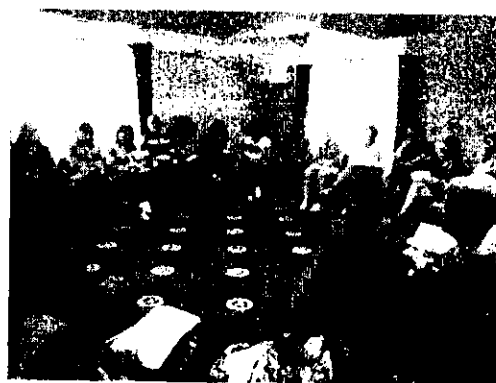
Снимки от Третата Национална Педагогическа конференция -- юни 2016г.