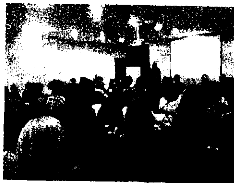
Снимки от Първата Национална Педагогическа конференция -- май 2015г.